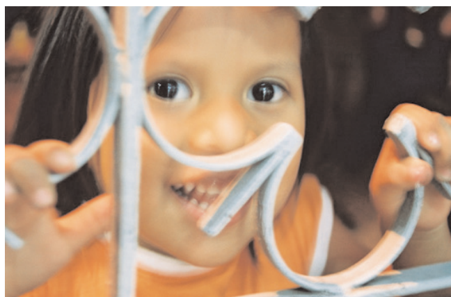
Feira Boliviana na praça, Kantuta, São Paulo.