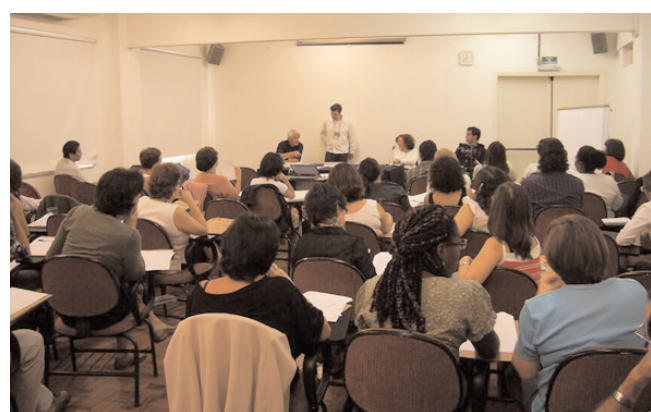
Instituto Pólis, São Paulo. Público asistiendo al seminario internacional "prácticas y políticas para inmigrantes internacionales: interpretaciones y propuestas". 8 de Octubre 2007.

Actualmente ya han sido tomados contactos con el instituto de investigación Gino Germani de la