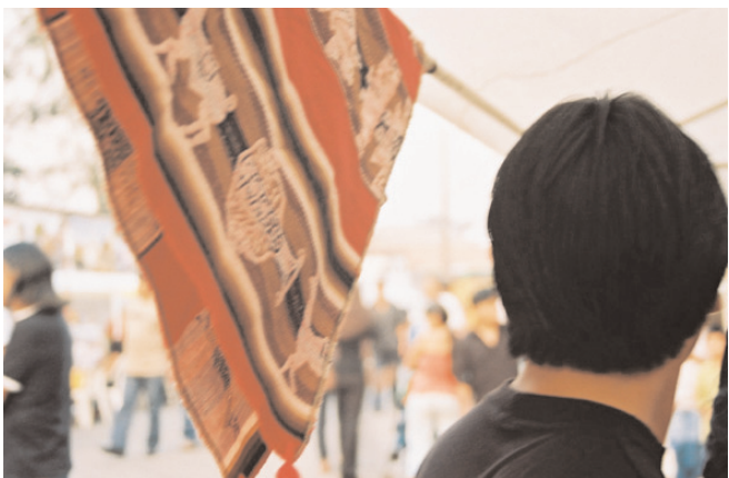
Feira Boliviana na praça, Kantuta, São Paulo.