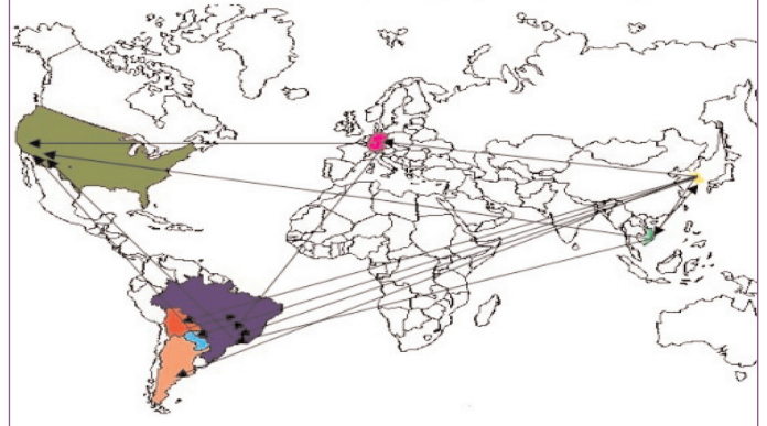
Mapa 1 Fluxos emigratórios de coreanos posteriores a promulgação da Lei de Incentivo a Emigração 11

Paulo, mas se estendem, atualmente, também a Buenos Aires; durante a década de 1960 e 1970, antes da grande crise boliviana, 9 também se constituíram na Bolívia. Nestas cidades, a mão de obra é composta, em sua maioria, por bolivianos e, em menor grau, por paraguaios, 10