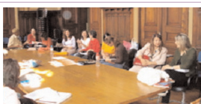
Primeira reunião da rede “Imigrantes: que visibilidade queremos” no Salão dos Anjos na Secretaria da Justiça e Defesa da Cidadania do Estado de São Paulo (02/10/07) © Cibernarium.